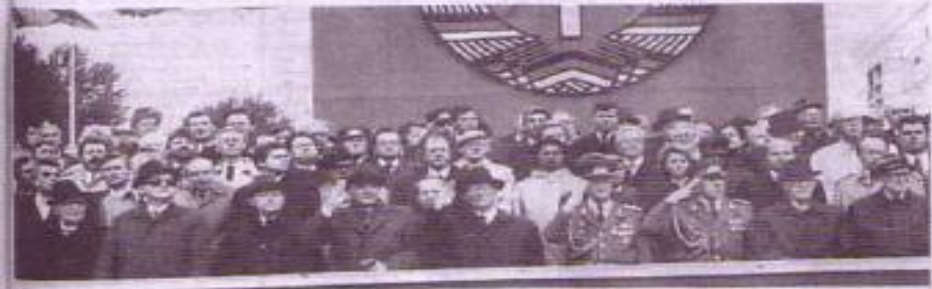
Karl-Marx-Allee in der Hauptstadt: Blick auf die Tribüne in der Karl-Marx-Allee

Michail Gorbatschow: Zum Jubiläum allen Bürgern der DDR die herzlichsten Grüße und Glückwünsche des sowjetischen Volkes / Wir sind fest entschlossen, unser allseitiges Zusammenwirken weiter zu entwickeln