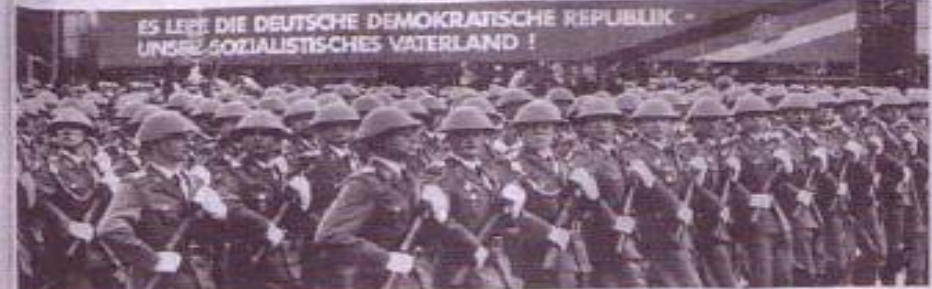
Parade von Soldaten der Nationalen Volksarmee