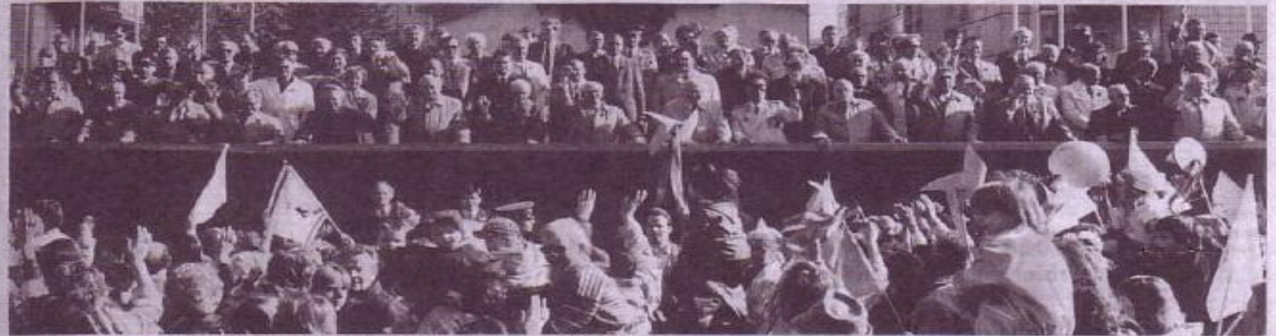
In Berlin Red-Mars-Aktion in großer Verbundform: gaben die Werbeposten die Partei- und Staatsführung