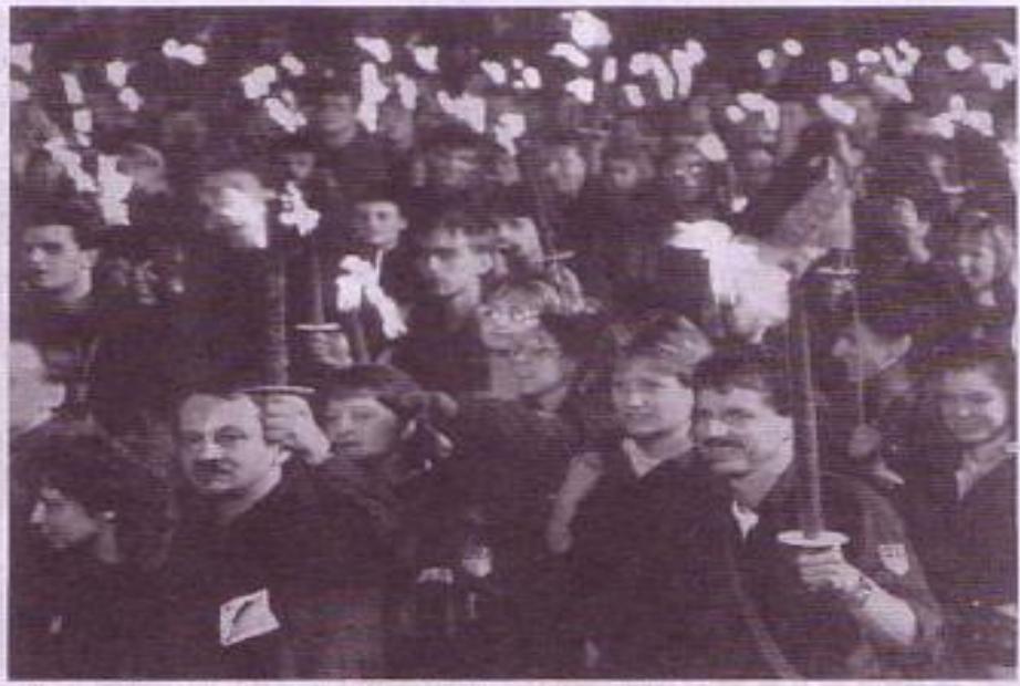
FDJler aus allen Bezirken betonen ihre Verbundenheit mit dem sozialistischen Vaterland