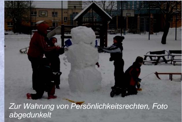
Zur Wahrung von Persönlichkeitsrechten, Foto abgedunkelt