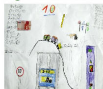
Mathematik ist mehr als Rechnen 30 Aufgaben, die zum Sprechen über mathematische Zusammenhänge anregen

Grundschule enthält 30 Aufgaben, die von den Berliner SINUS-Schulen ausprobiert und für gut befunden oder selbst entwickelt wurden. Im Fokus stand dabei neben der Förderung des Unterrichtsgesprächs besonders die damit eng verbundene