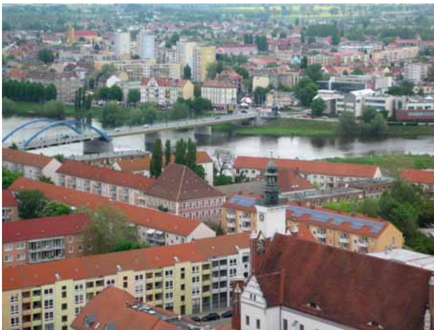
Brücke über die Oder in Frankfurt (Oder) / Slubice, Foto: Hannelore Büchler

Mit der Aufnahme Polens in die EU und dem Abbau der Grenzkontrollen wurde es unkompliziert und völlig „normal“, von Deutschland nach Polen und von Polen nach Deutschland zu fahren, der Einkaufstourismus ist einem Kulturtourismus gewichen, auf beiden Seiten wuchsen das gegenseitige Verständnis und die Akzeptanz.