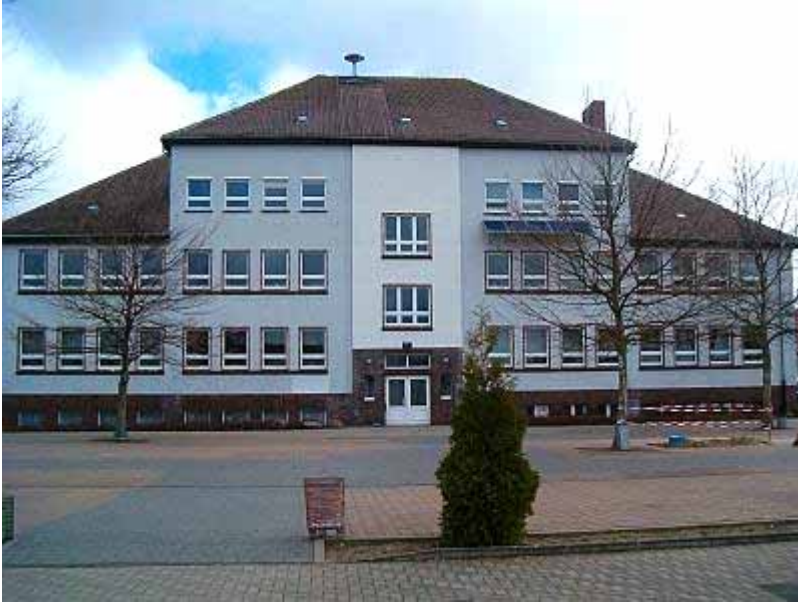
Grundschule Gartz (Oder), Foto: privat

In den zurückliegenden 20 Jahren hat sich die Schullandschaft zum Teil erheblich verändert. Nicht nur Schulgebäude und ihre Einrichtungen waren augenscheinlichen Veränderungen unterworfen, sondern auch der Schul- und Unterrichtsalltag der Schülerinnen und Schüler. Von besonderem Interesse kann es deshalb für sie sein, herauszufinden und zu dokumentieren, wie Demokratisierungsprozesse an ihrer Schule vorangeschritten sind, welche Erfolge die Schule zu verzeichnen hat, aber auch welche Schwierigkeiten zu überwinden und welche Probleme zu lösen waren.