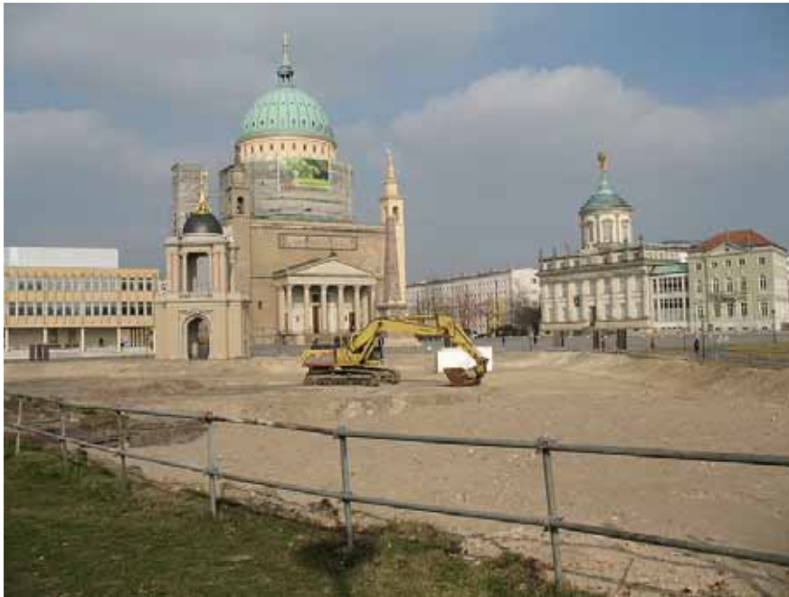
Das Fortunaportal in Potsdam mit den ersten Vorbereitungsarbeiten für den Bau des neuen Brandenburger Landtages, (24.02.2008)

In den letzten 20 Jahren haben sich viele Ortschaften im Land Brandenburg zum Teil stark verändert. Gebäude wurden abgerissen, renoviert oder neu gebaut. Aus vielen Ruinen wurden wieder Schmuckstücke und denkmalgeschützte Objekte erstrahlen wieder in ihrem ehemaligen Glanz. Es entstanden neue Straßenführungen und Verkehrsanbindungen. Teilweise sind durch Eigenheimbau ganze Ortsteile neu errichtet worden.