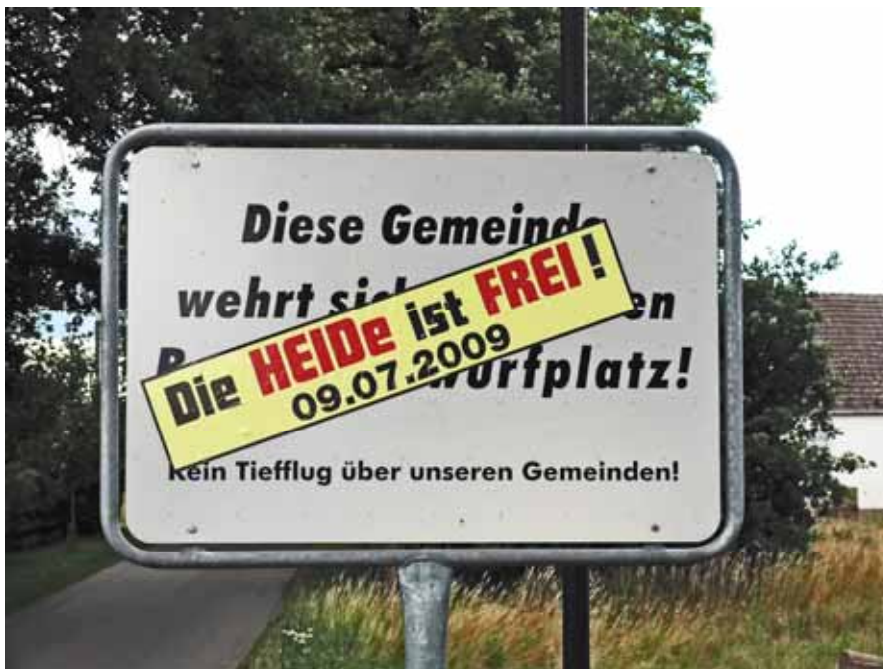
Kyritz-Ruppiner-Heide, Ortsprotestschild, Foto: Rainer Kühn

Ein aktuelles Beispiel ist die weitere Nutzung des ehemaligen Bombodroms in der Kyritz-Ruppiner Heide als Tourismusgebiet.