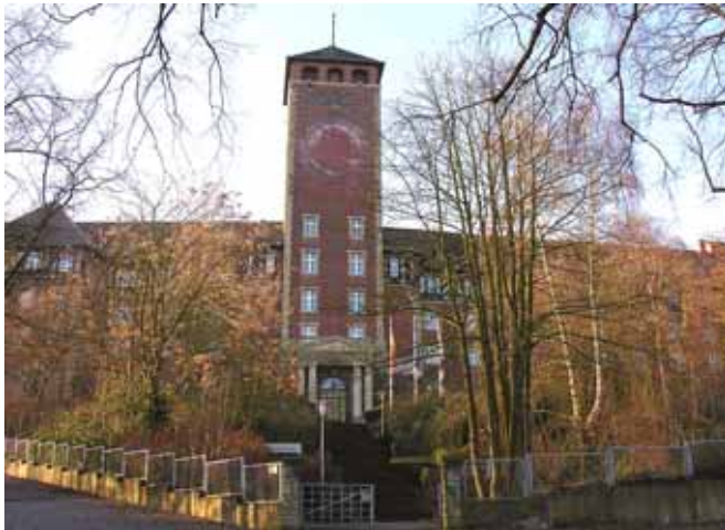
Landtag Brandenburg auf dem Brauhausberg Potsdam, fotografiert von Wolfgang Pehlemann, Wiesbaden 2008

Mit dem Beitritt der DDR zum Geltungsbereich des Grundgesetzes der Bundesrepublik Deutschland am 3. Oktober 1990 wurde zugleich das alte Land Brandenburg neu gegründet. Damit gehört Brandenburg als Teil des vereinigten Deutschlands der Europäischen Union an. Seitdem kam es zu grundlegenden Veränderungen. Sie betrafen das politische System, die Rechts- und Sozialordnung. Sie zielten auf die Umstellung der Zentralverwaltungs- auf die Marktwirtschaft und der zentralistischen Herrschaftsstrukturen auf Rechtsstaatlichkeit und Demokratie. Mit neuen Wegen in Bildung und Kultur eröffneten sich vielfältige Perspektiven; es galt aber auch komplizierte Probleme zu bewältigen.