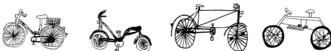
Abbildung 2: Fahrrad-Zeichnungen von 10-jährigen Kindern (entnommen aus Zolg 2001, S. 3).

Kindern gewähren, andererseits aber auch bereits das Ordnen und Hinterfragen der eigenen Vorstellungen anregen. „Durch Zeichnen verwandeln sich flüchtige Vorstellungen in Bilder von einiger Dauer. Ihre Elemente können deshalb in ihren Beziehungen zueinander simultan erfasst werden. Als Metapher ausgedrückt: Beim Zeichnen stehen die Kinder ihren Vorstellungen gegenüber. Dadurch bildet sich die Distanz, die für eine objektivierende Betrachtung unerlässlich ist. Zeichnen ist Prozess und erlaubt deshalb den Nachvollzug und das Mitdenken anderer; es regt die Diskussion an. Zeichnen gibt dem Wahrgenommenen und dem Vorgestellten einen höheren Bewusstseinsgrad, hilft Vorstellungsmängel zu entdecken und lenkt die Aufmerksamkeit.“ (Biester 1991, S. 61)