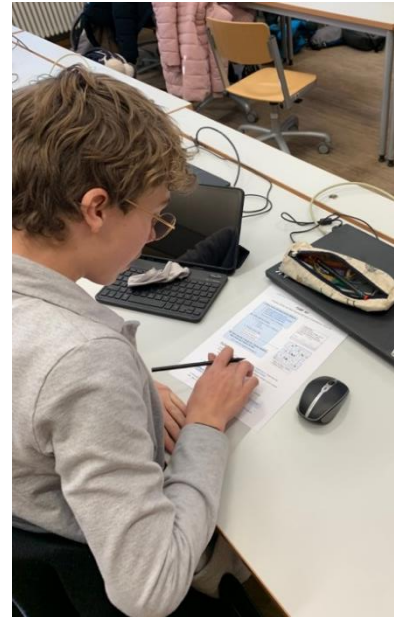
Abb. 4: Beschäftigung mit dem AB „Pimp my ...“

Um Bewegung in den Workshop zu bringen, gab es Fragen, die verlangten, dass die Schüler:innen aufstehen oder eine bestimmte Position im Raum einnehmen. Darunter war z. B. folgende Verständnisfrage: „Darfst du ein Bild verwenden, das du im Internet (ohne Filter) gefunden hast, wozu dir keine Lizenzierung angezeigt wird?“ – Die Medienscouts erhoben sich für ein „Nein“.