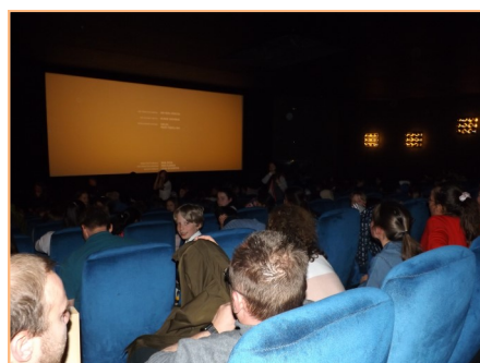
Allseits zufriedene Gesichter bei der Abschlussveranstaltung der Grundschulen.