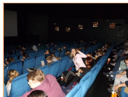
Auch bei der Abschlussveranstaltung der Oberschulen sind die Reihen gut gefüllt.