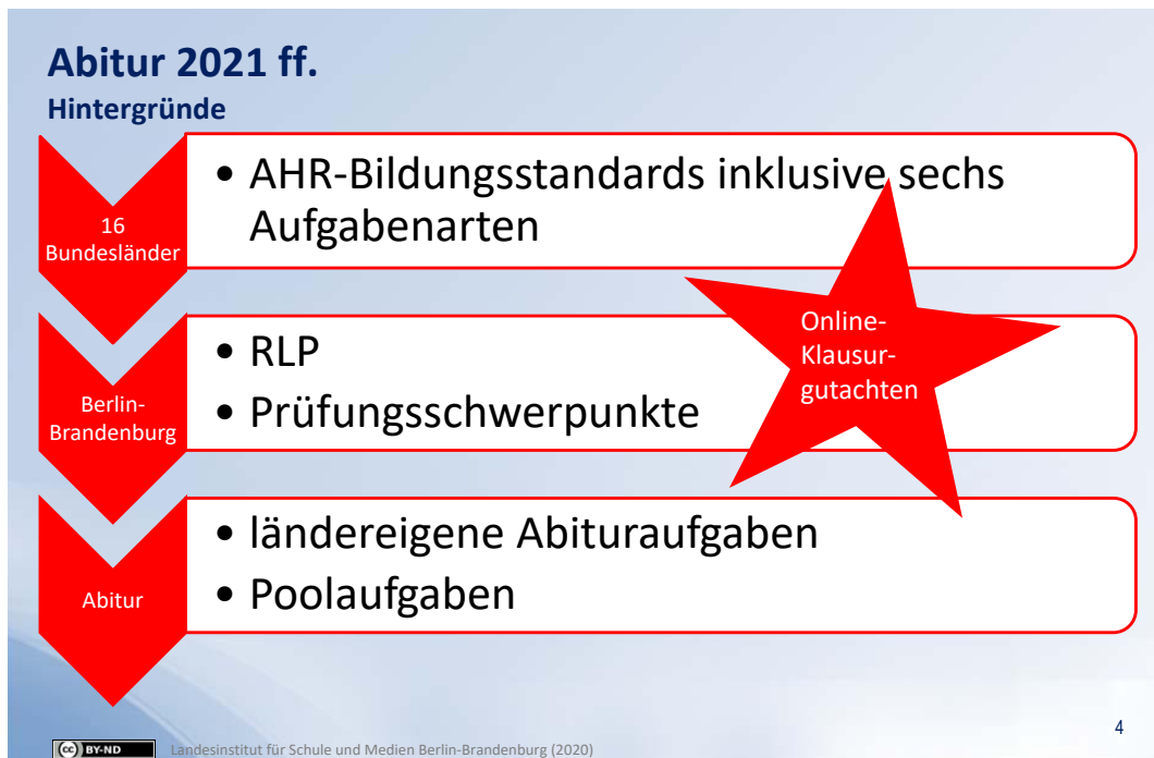
Abbildung 1:

Im Rahmen der schriftlichen Abiturprüfung im Fach Deutsch entnehmen Berlin und Brandenburg seit 2017 auch Prüfungsaufgaben aus dem gemeinsamen Abituraufgabenpool der Länder. Der Einsatz der Aufgaben des Pools in den ländereigenen Aufgabensets ist ein wesentliches Instrument, um die Implementierung der KMK-Bildungsstandards für die Allgemeine Hochschulreife im Fach Deutsch sowie die angestrebte Vergleichbarkeit der Prüfungsanforderungen zu unterstützen und voranzubringen.