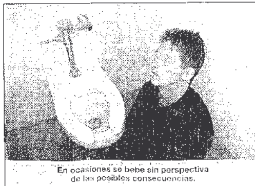
En ocasiones se bebe sin perspectiva de las posibles consecuencias.

0-1 Un consumo excesivo de alcohol de forma prolongada con dependencia del mismo. Una enfermedad crónica producida por el consumo incontrolado de bebidas alcohólicas, lo que interfiere en la salud física, mental, social y/o familiar así como en las responsabilidades laborales ". Ésa es la definición de alcoholismo, un calificativo que ha estado en boca de muchos durante las últimas dos semanas. El "botellón" convocado en más de veinte ciudades españolas, el pasado viernes 17, ha reabierto un debate social que se aviva cada cierto tiempo para volver después a calmarse .