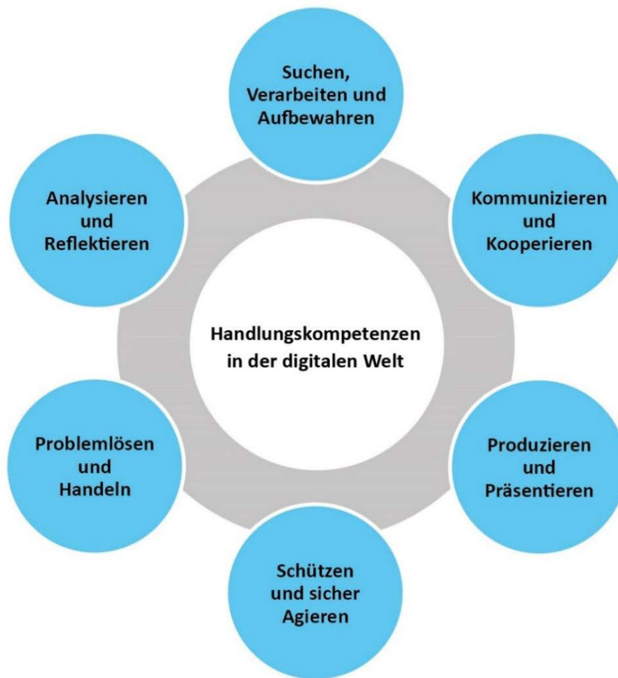
Abbildung 2: Kompetenzen in der digitalen Welt

Da die berufliche Bildung wesentlich von der Digitalisierung und deren Rückwirkung auf Arbeits-, Produktions- und Geschäftsabläufe betroffen ist, wurden zusätzlich zum Kompetenzrahmen der vorgenannten KMK-Strategie und ihrer Ergänzung sieben spezifische Anforderungen für berufliche Schulen formuliert, die neben dem Verständnis für digitale Prozesse ebenfalls die mittelbaren Auswirkungen der fortwährenden Digitalisierung, z. B. hinsichtlich arbeitsorganisatorischer und kommunikativer Aspekte in teilweise global vernetzten Geschäftsbeziehungen, einschließen: