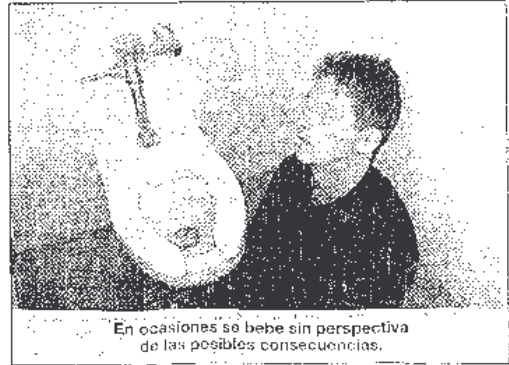
En ocasiones se bebe sin perspectiva de las posibles consecuencias.

0-1 Un consumo excesivo de alcohol de forma prolongada con dependencia del mismo. Una enfermedad crónica producida por el consumo incontrolado de bebidas alcohólicas, lo que interfiere en la salud física, mental, social y/o familiar así como en las responsabilidades laborales ". Ésa es la definición de alcoholismo, un calificativo que ha estado en boca de muchos durante las últimas dos semanas. El "botellón" convocado en más de veinte ciudades españolas, el pasado viernes 17, ha reabierto un debate social que se aviva cada cierto tiempo para volver después a calmarse .