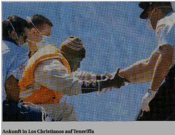
Ankunft in Los Christianos auf Teneriffa

Allein am vergangenen Wochenende erreichten mehr als ein Dutzend Boote die spanischen Inseln