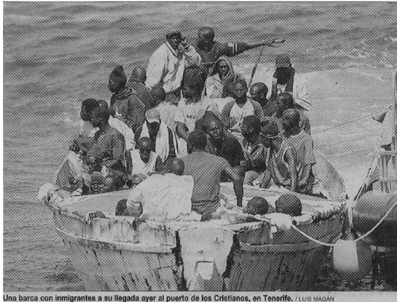
Una barca con inmigrantes a su llegada ayer al puerto de los Cristianos, en Tenerife.