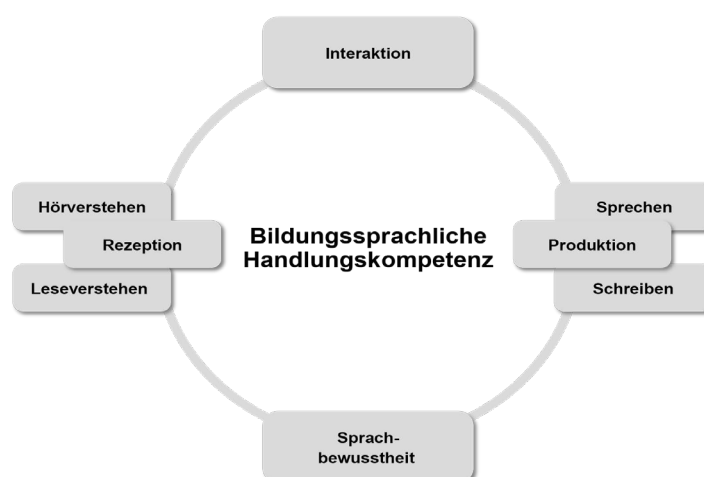
Abb. 1: © SenBJW, MBJS, Hrsg., 2015. Rahmenlehrplan für die Jahrgangsstufen 1 – 10 13

Das Kompetenzmodell zur Sprachbildung im Basiscurriculum Sprachbildung (Abb. 1) aus dem Teil B des Rahmenlehrplans für die Jahrgangsstufen 1 – 10 (RLP 1 – 10) enthält sechs sprachliche Kompetenzbereiche. Diese sollen auch im Rahmen der Unterrichtsplanung im Bildungsgang der Staatlichen Fachschule für Sozialpädagogik berücksichtigt werden.