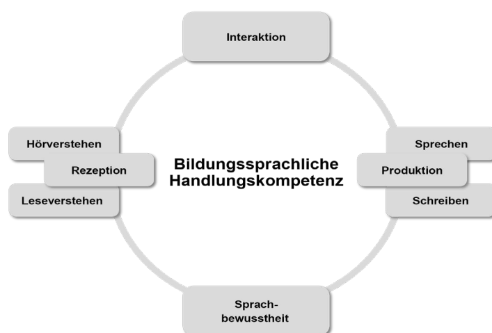
Abb. 1: © SenBJW, MBJS, Hrsg., 2015. Rahmenlehrplan für die Jahrgangsstufen 1 – 10 13

Das Kompetenzmodell zur Sprachbildung im Basiscurriculum Sprachbildung (Abb. 1) aus dem Teil B des Rahmenlehrplans für die Jahrgangsstufen 1 – 10 (RLP 1 – 10) enthält sechs sprachliche Kompetenzbereiche. Diese sollen auch im Rahmen der Unterrichtsplanung im Bildungsgang der Staatlichen Fachschule für Sozialpädagogik berücksichtigt werden.